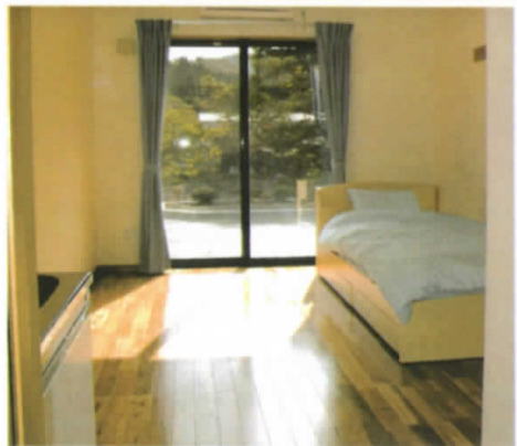
明るく設備も充実した居室

◆ご利用できる方は 認知症の診断があり要介護認定を受け、要介護1以上の方でおおむね、身の自立ができ、支障なく共同生活を送ることができる方 ◆お申し込み方法 グループホームリアスの社に直接お申し込み下さい。また、現在ご利用中の在宅介護支援センターや居宅介護事業所のケアマネージャーを通じてご相談下さい。申込書を提出いただき、その後、職員が面談を行わせていただきます。 ◆入居期間 特に制限はありません。 ◆協力医療機関 本吉町国民健康保険病院