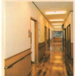
◆廊下 ゆとりある広めの廊下になっております。