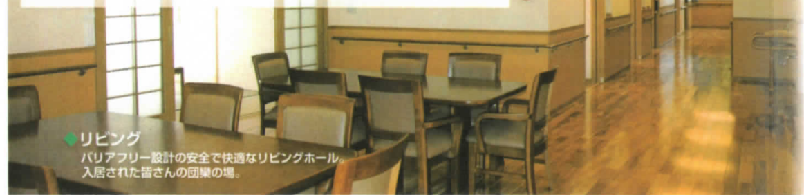
◆リビング バリアフリー設計の安全で快適なリビングホール。入居された皆さんの団場の場。