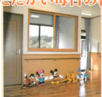
◆玄関 明るく美しい陽光あふれる玄関。