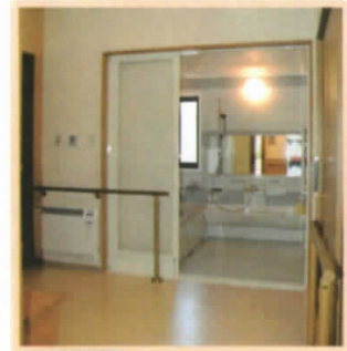
◆風呂場 手すりがついた安全設計で、大きめのユニットバスです。