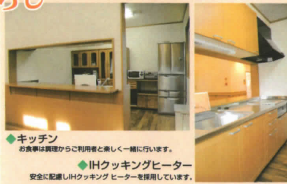
◆キッチン お食事は調理からご利用者と楽しく一緒にいきます。 ◆IHクッキングヒーター 安全に配慮しIHクッキングヒーターを採用しています。

◆ご利用できる方は 認知症の診断があり要介護認定を受け、要介護1以上の方でおおむね、身の自立ができ、支障なく共同生活を送ることができる方 ◆お申し込み方法 グループホームリアスの社に直接お申し込み下さい。また、現在ご利用中の在宅介護支援センターや居宅介護事業所のケアマネージャーを通じてご相談下さい。申込書を提出いただき、その後、職員が面談を行わせていただきます。 ◆入居期間 特に制限はありません。 ◆協力医療機関 本吉町国民健康保険病院