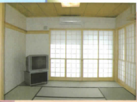
◆居間 入居者の皆さんがゆったりと落ち着いた和室でこころゆくまでおくつろぎになれます。

暮らしのあらゆる場面で 経験豊かなスタッフが 24時間お手伝いを させていただきます。