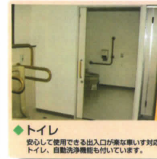
◆トイレ 安心して使用できる出入口が楽な車いす対応トイレ、自動洗浄機能も付いています。

暮らしのあらゆる場面で 経験豊かなスタッフが 24時間お手伝いを させていただきます。