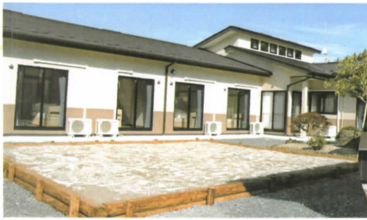
家庭菜園のスペースもございます。